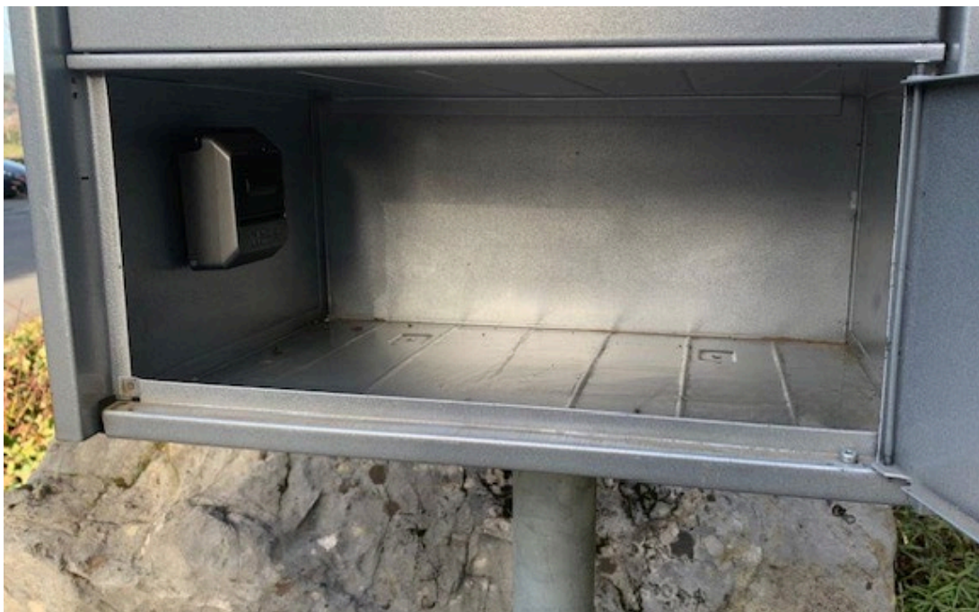
Montagevariante im Briefkasten

Bis jetzt haben wir mit dieser Montageversion nur positive Rückmeldungen erhalten.